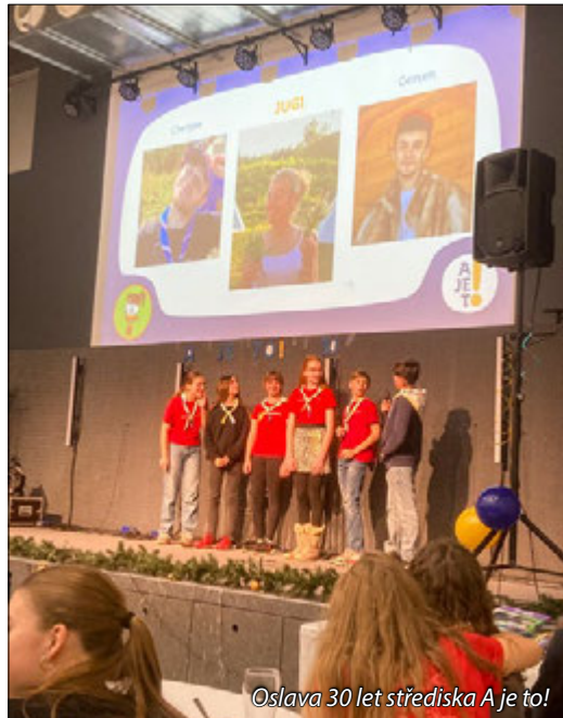
Oslava 30 let střediska A je to!