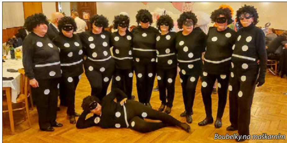
Boubelky na maškarním

Po všech přípravách, jak kostýmů, tak i textu pro divadelní představení, jsme v pátek 9. 2. pochovaly basu. Diváci se dobře bavili a sklidily jsme velkou chválu. Prý se nám dařilo lépe než loni, z čehož jsme měly samozřejmě radost. Zvláště jsme rády, že jsme jedna z posledních vesnic v okolí, která tuto tradici stále udržuje, a tak nám ji mnozí z okolí i upřímně závidí.