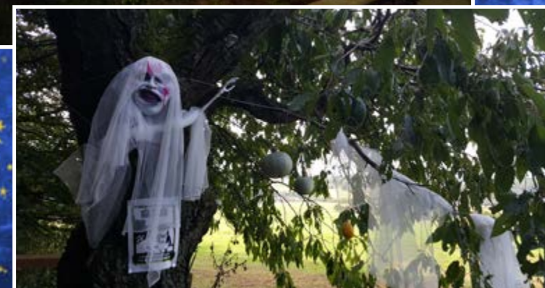
Bar u krav na Halloweena