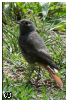
Na přiložených snímcích: 01 strakapoud prostřední na lojové kouli • 02 samec rehka domácího při krmení mláďat • 03 odrostlé mládě rehka domácího