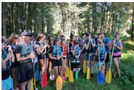
Vodácký výcvik 8. ročníku

Ve dnech 9. až 11. září absolvovali žáci šestých ročníků tradiční adaptační pobyt. Po loňských pozitivních ohlasech se obě třídy, společně s třídními učiteli, asistentkami a preventistkou primárně patologických jevů, opět vypravili vlakem do Blanska. Zde, po zdolání nekonečného kopce, na kterém se každou chvíli ozývalo: „Už tam budem?“, rozbili tábor v rekreačním středisku Vyhlídka. Pro šestáky bylo nachystáno mnoho zajímavých aktivit, při kterých měli možnost poznat nejen své učitele, ale i sebe sama navzájem. Ve volných chvílích se pak téměř všichni věnovali sportovním aktivitám, kterým vládli fotbal a basketbal. Tři dny utekly jako voda a díky pestrému programu, vynikajícímu kolektivu a nádhernému počasí nikoho nezaskočila ani závěrečná cesta na vlak, ani změna režimu nošení roušek.