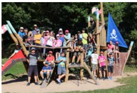
Adaptační pobyt 6. ročníku

Do okolí Moravského krasu, do obce Suchý, se vydaly děti druhých tříd, které strávily svoji školu v přírodě pod heslem „Pod pirátskou vlajkou“. Druháci psali pirátský deník, skládali zkoušku z plavby na člunu, ze šplhání v lanoví či z přetahování. Vydali se také na výlet do Sloupsko-šošůvských jeskyní, absolvovali stezku odvahy a chybět nesměl ani pirátský poklad.