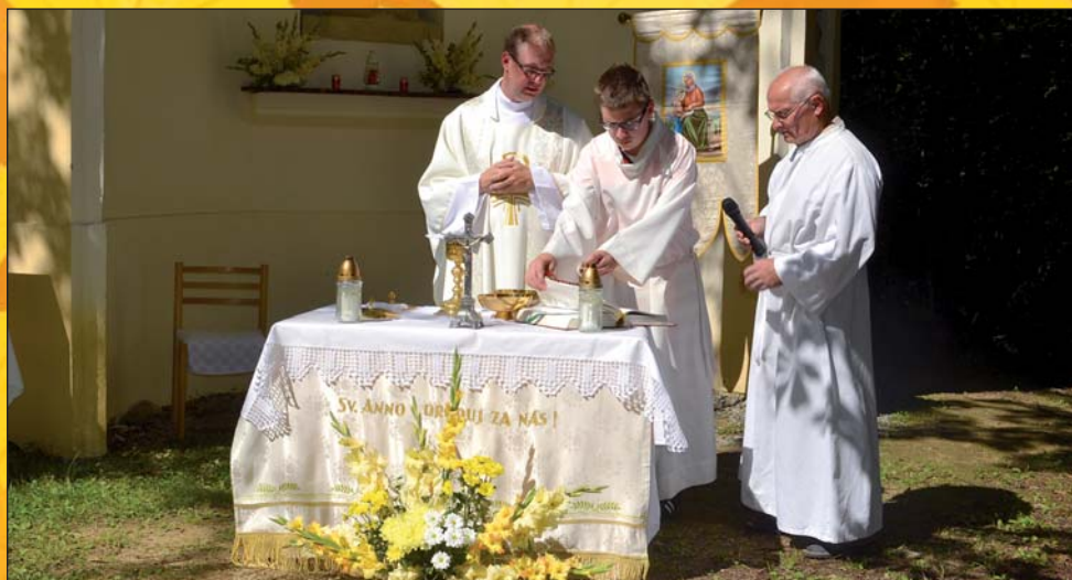
Mše u kaple sv. Anny