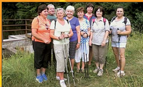
Senioři – setkání ve starém lomu a na vycházce