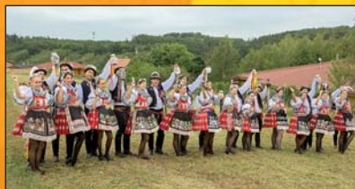
Stárky a stárce