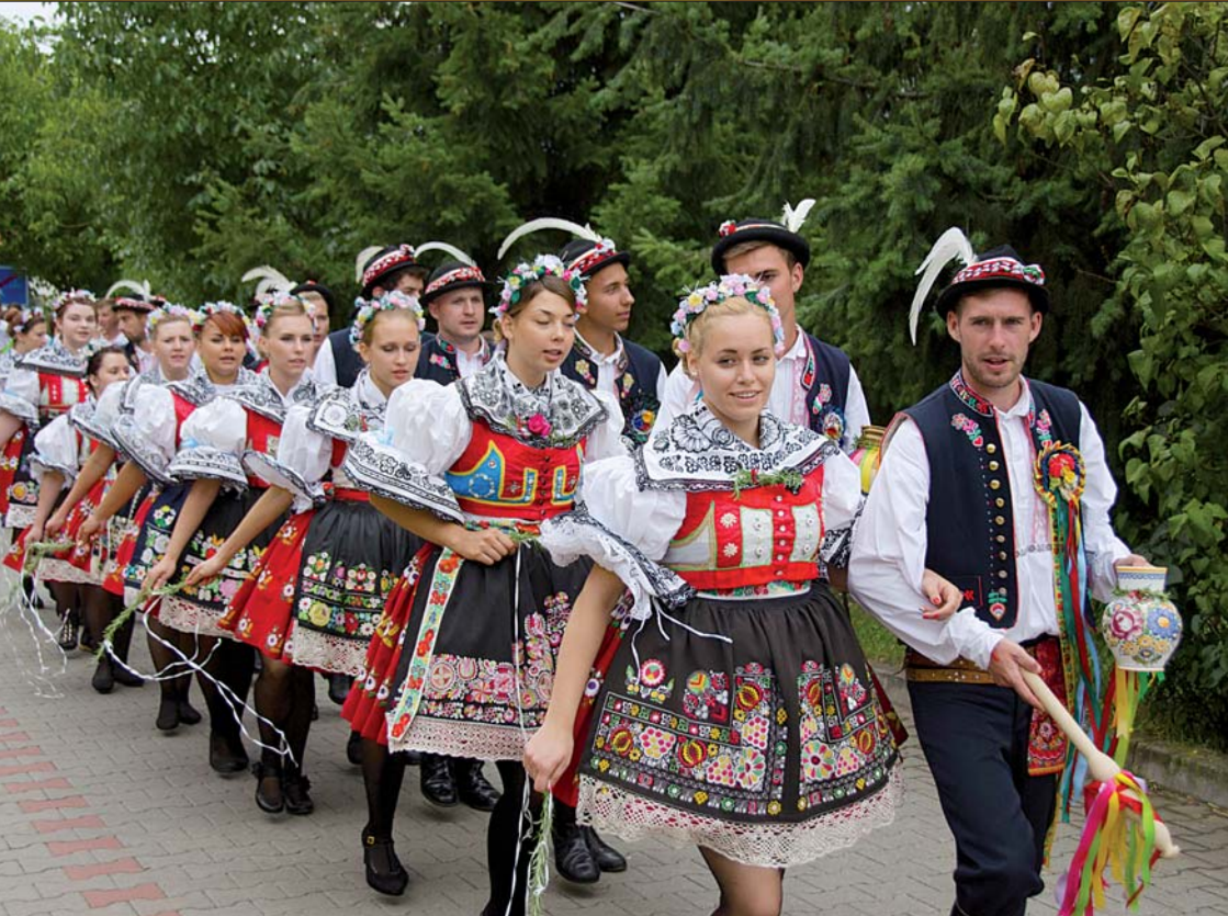
Párové hody 2017