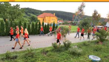
Příprava na hody