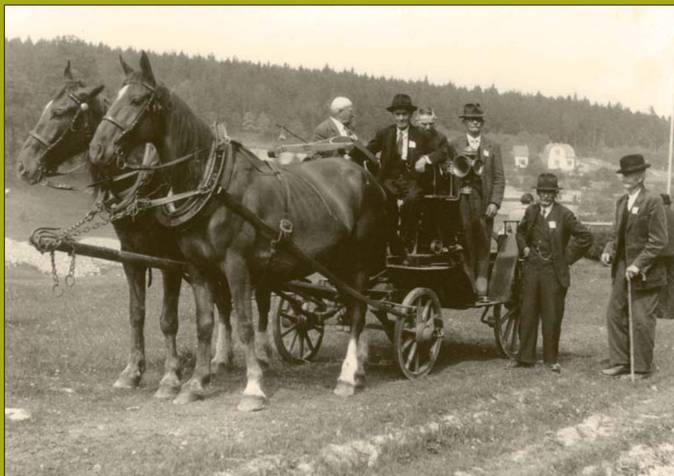
Třicet let trvání sboru – r. 1936