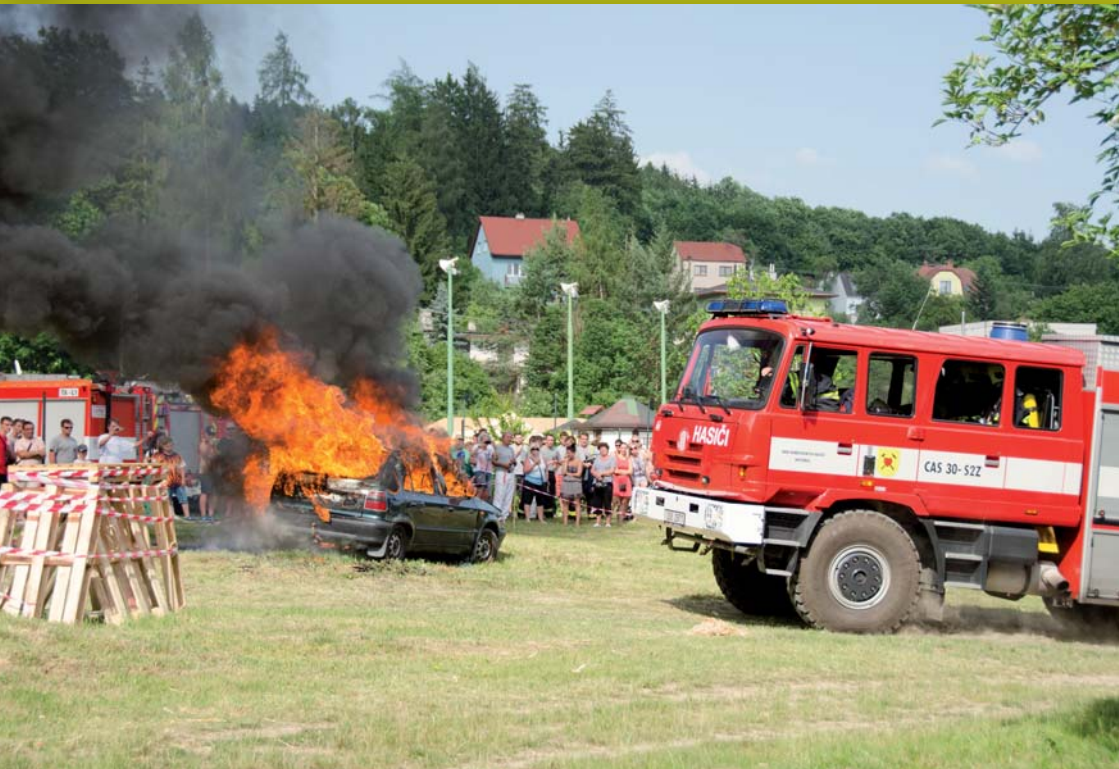
OSLAVY 110. VÝROČÍ SDH – UKÁZKA HAŠENÍ POŽÁRU