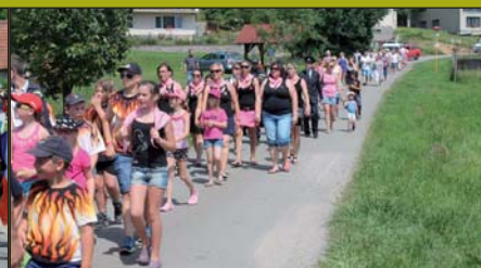
OSLAVY 110. VÝROČÍ SDH