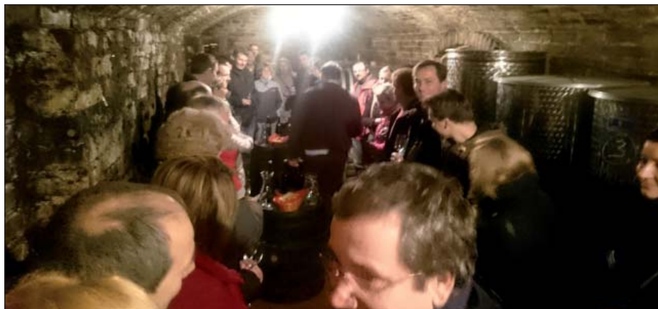
Výlet do sklepa v Němčičkách

Ve finále Libor se Zdenkem prodali své zkušenosti, po setech 3:6, 6:1, 6:1 porazili Filipa s Lukášem a stali vítězi Letní tenisové ligy Na Pastviskách 2015. Patří jim zasloužená gratulace, stejně jako všem hráčům a hráčkám, bez kterých bychom LTL neuspořádali. Myslím si, že se i přes některé počáteční neduhy a prodloužení celé