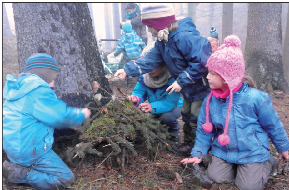
Děti při hře v lese

Až přijdou plískanice, mlhy a mrazu bude víc než je milé, bude stačit jen zavřít oči a v hlavičkách dětí se spustí krásný barevný film. Bude mít jásavé červenožluté barvy podzimního listí, vonět bude po čaji z nasbíraných šípků, jazýček si vzpomene jak chutnal mošt z padaných jablek v sadu, do uší zazní klapot kopyt koně, který k nám přijel na sv. Martina a určitě bude slyšet i výskot z bukové stráně - právě tam v závějích napadaného listí kutálí sudy banda kluků a holčiček. Až se dokutálí dolů, půjdou společnými silami postavit most přes potok, velkou chýši z větví a ještě je-