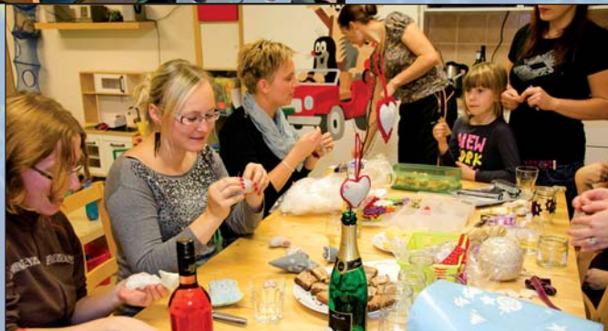
RC Broučci –předvánoční tvoření