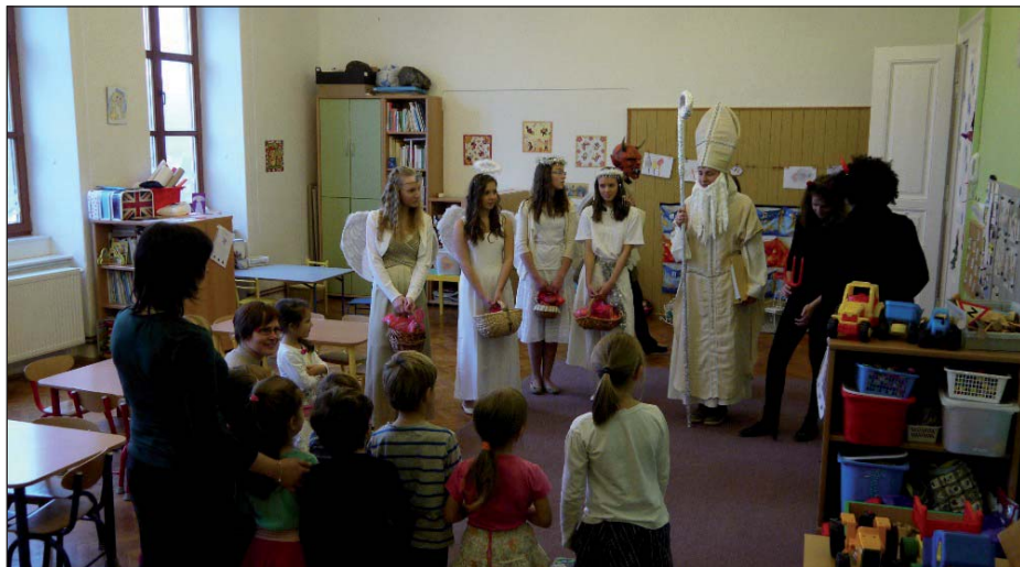
Mikuláš v MŠ

Zato v pátek 4. prosince byla v některých dětech přece jen malá dušička, jestli jsem byl opravdu hodný a co na to řekne ten pan Mikuláš, a co když ten čert přece jen není kamarád. Ale všechno dobře dopadlo. Svatý Mikuláš se svým početným andělským a čertovským doprovodem vyčetl ve Zlaté knize, že máme ve školce samé hodné děti a všem, i těm, které se nemohly slavnosti kvůli nemoci zúčastnit, přinesl balíček plný dobrot. Děti jim za nadílku krásně zarecitovaly a zazpívaly.