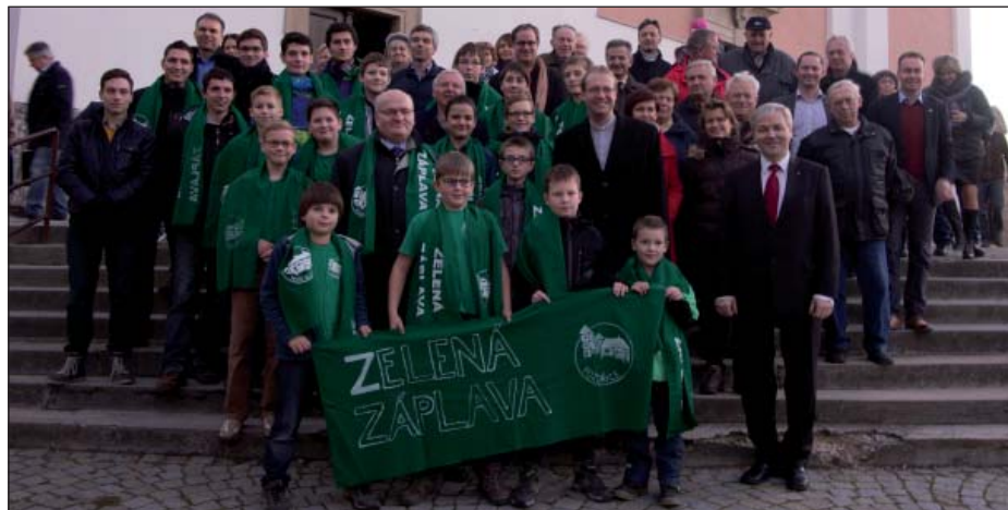
S panem ministrem kultury před kostelem

Určitě jste si při průjezdu Pozořicemi všimli, že průčelí kostela včetně obou věží je opraveno a letošní práce na opravě fasády jsou u konce. První etapa opravy