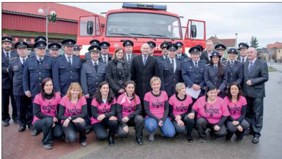
Slavnostní předání cisterny CAS 30-S2Z

K zásahům a různým událostem nás vždy ve zdraví dopravila naše cisterna CAS – 25, Škoda 706 RTHP vyrobená v roce 1977. Toto speciální vozidlo spolu s námi za-