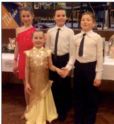
Vystoupení dětí z taneční školy STARLET