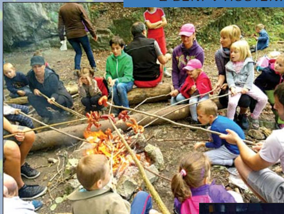
Skauti – výlet s rodiči na začátku školního roku