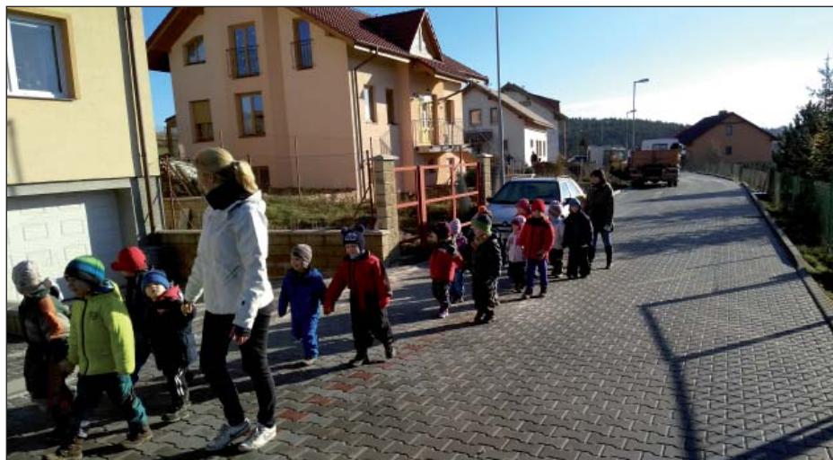
MŠ na procházce po Záhumenkové po realizaci komunikace