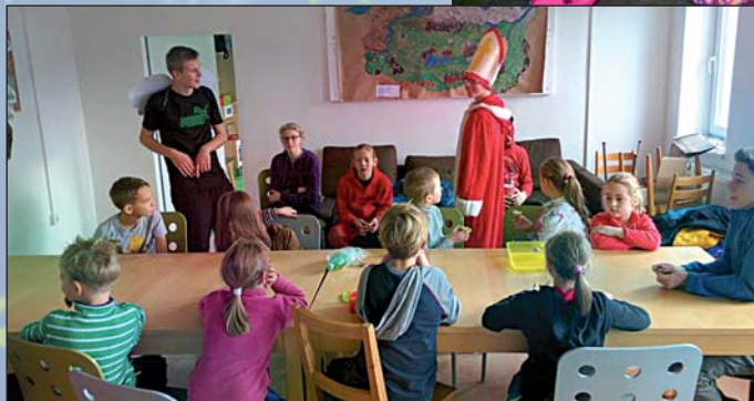
Mikulášský výlet skautů