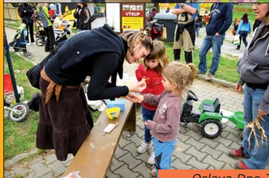
Oslava Dne Země a pálení čarodějnic