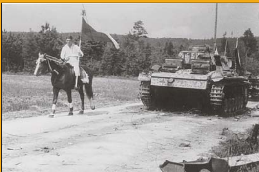
Průvod z Hostěnic jde na oslavu do Pozořic

Ruský radista a partyzán v r. 1966 mezi místními hasiči.