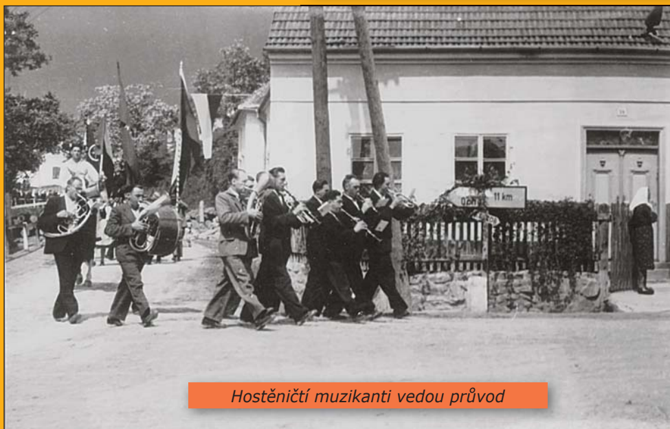
Hostěničtí muzikanti vedou průvod