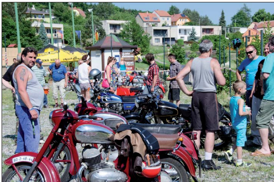
Text a foto Magda Hradilová

První červnovou sobotu se na prostranství u hřiště Na Pastviskách uskutečnil již 2. ročník Srazu veteránů. Návštěvníci si mohli prohlédnout v pohybové i klidové fázi několik desítek dopravních prostředků - od prastaré tříkolky a kol, přes motorky nejrozmanitějších kubatur a osobní vozy, až po letitý traktor. Zasloužené pozornosti se těšil zvláště jeden z nejstarších exponátů - krásný předválečný automobil Praga. Součástí srazu byla i spanilá jízda po okolí Hostěnic.