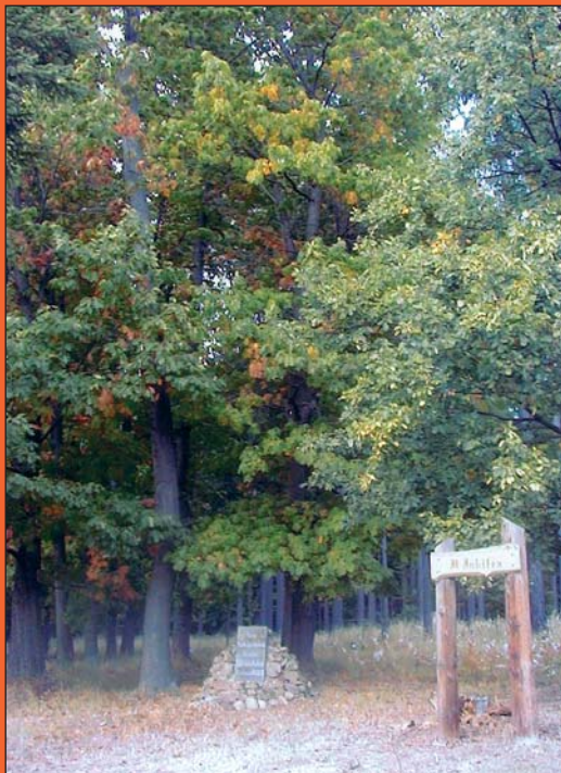
Celkový pohled na památník