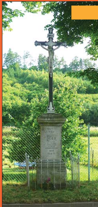
Kříž z roku 1879