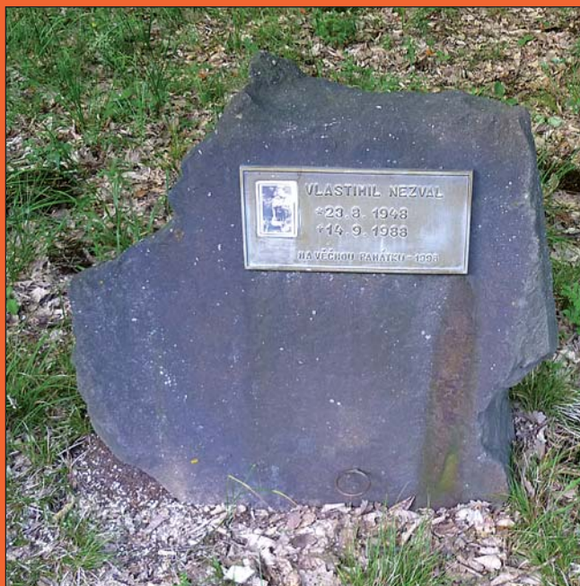
Pomníček Vlastimila Nezvala