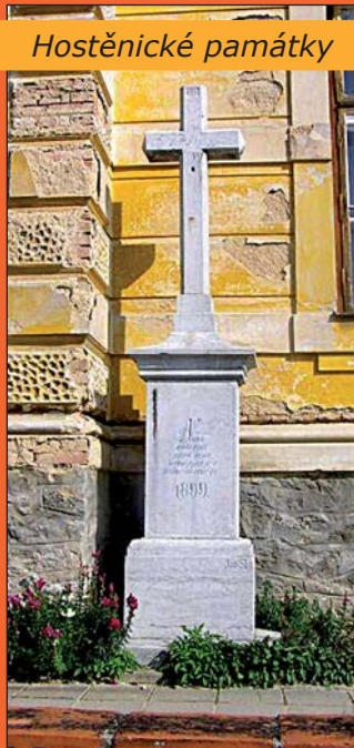
Kříž z roku 1899