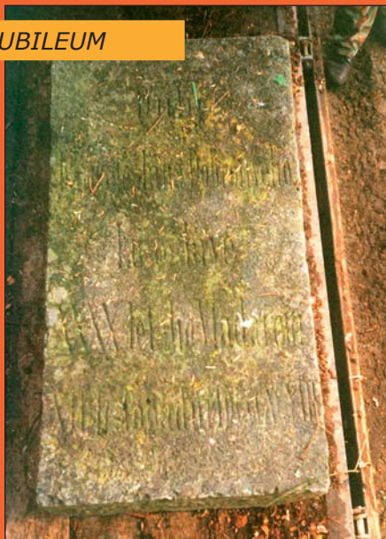
Stav před opravou