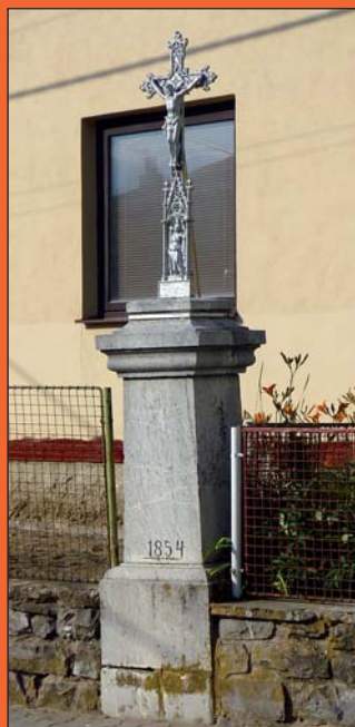
Kříž z roku 1854