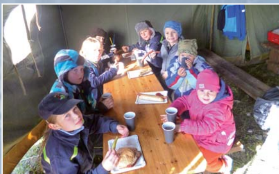
Naši mladí hasiči nabírají síly