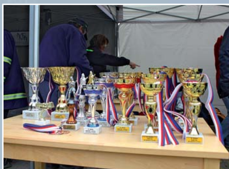
Poháry pro vítěze