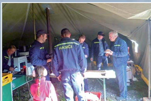
Naši hasiči při zajišťování občerstvení