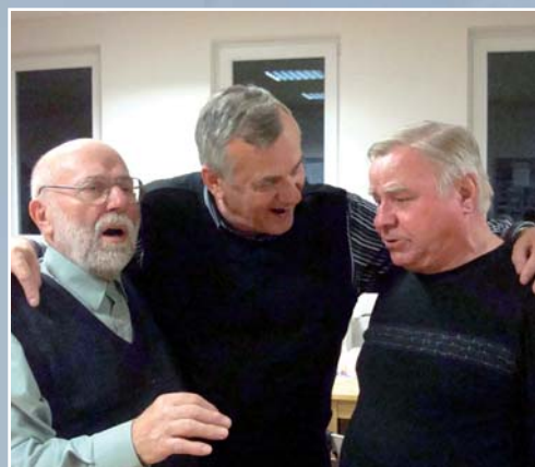
V občanském centru