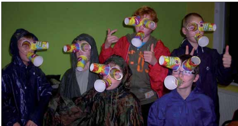
Skauti na podzimních prázdninách v Ratíškovících

Tento výlet se mi velice líbil, protože byl originální. Zajímavé to bylo v Karlových Varech, kde byly prameny a lanovka. Cestu vlakem jsem si velmi užil, protože jsme si zahráli Magicky (na které nemáme moc čas), dostali jsme karetní hru Sacculus, kterou jsme si ihned zahráli a na cestě domů jsme se dozvěděli naši celoroční hru. A také jsme skončili na 44. místě, které je velmi dobré. Už se těším na další rok téhle hry.