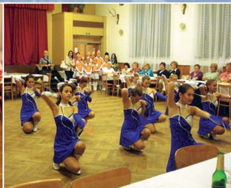
Vystoupení hostěnických boubelek a mažoretek