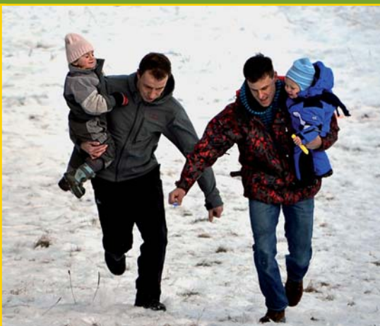
Silvestrovský běh do vrchu