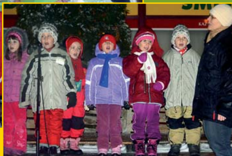
Vystoupení dětí u Vánočního stromu