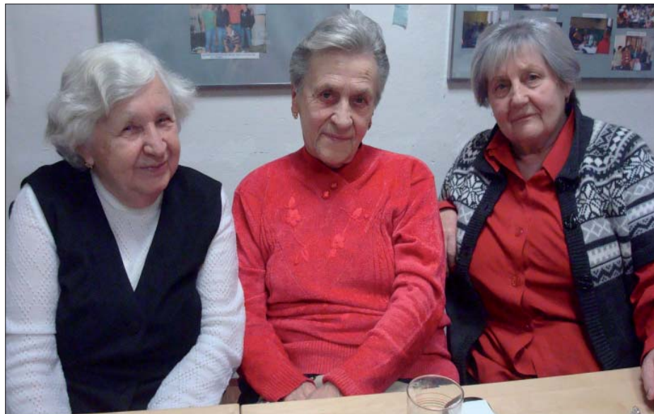
Setkání seniorů v Občanském centru

Pokud se ohlédneme zpět, patří mezi akce poměrně zdařilé např. výstava obrazů uskutečněná v sále „U Stupárků“. Byla to výstava, která měla seniory, ale i ostatní občany seznámit s tvorbou místních amatérských malířů nebo malířů zachycujících naši obec či okolní krajinu. Podařilo se soustředit přes 60 obrazů žijících i nežijících autorů a pochlubit se svým uměním mohly i děti z naší mateřské školky. Výstavu navštívilo přes 100 seniorů i dalších občanů. Velice navštívená byla i beseda nad starými fotografiemi. Sešlo se cca 80 lidí a řada z nich přinesla fotografie dokumentující život v obci před desítkami let. Oblíbené byly i zájezdy s paní A.Tupou. Na některá místa v okolí naší obce se někteří senioři dostali až v rámci vycházek za poznáním okolí obce.