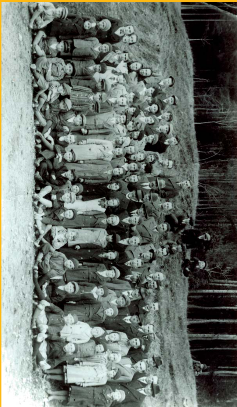
Členové hostěnického Sokola na původním sokolském hřišti r. 1938