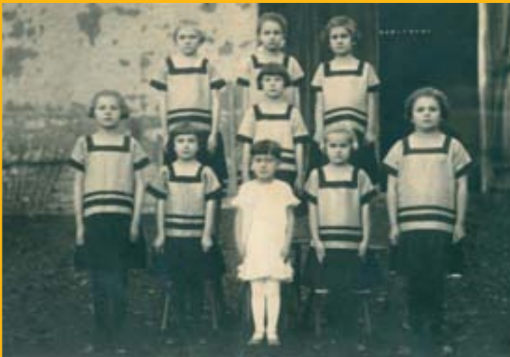
Děvčata Sokolky r. 1930