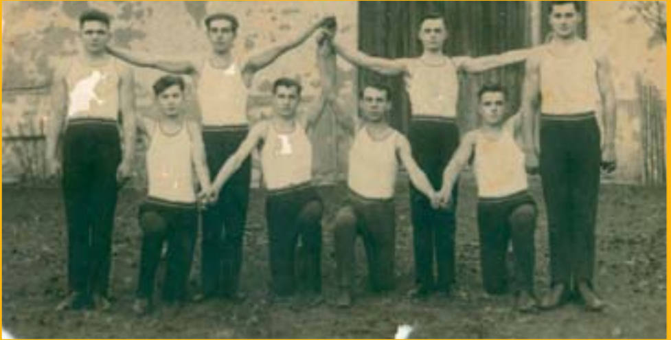
Členové Sokola po veřejném vystoupení