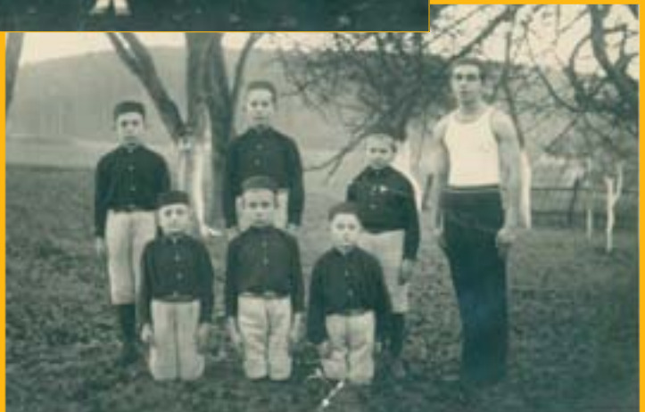
Mladí hostěničtí Sokoli r. 1927