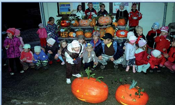
Společné foto tvůrců s rozzářenými dýněmi