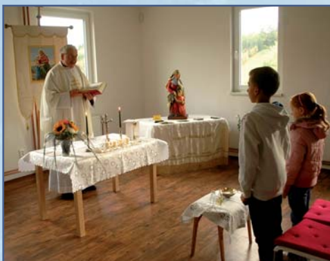
Bohoslužba v Občanském centru