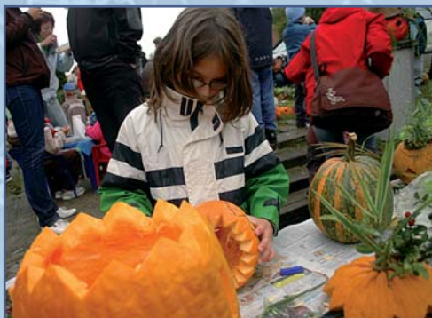
Do tvorby se pustili nejen děti,...