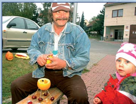
... ale i nadšení dospělí