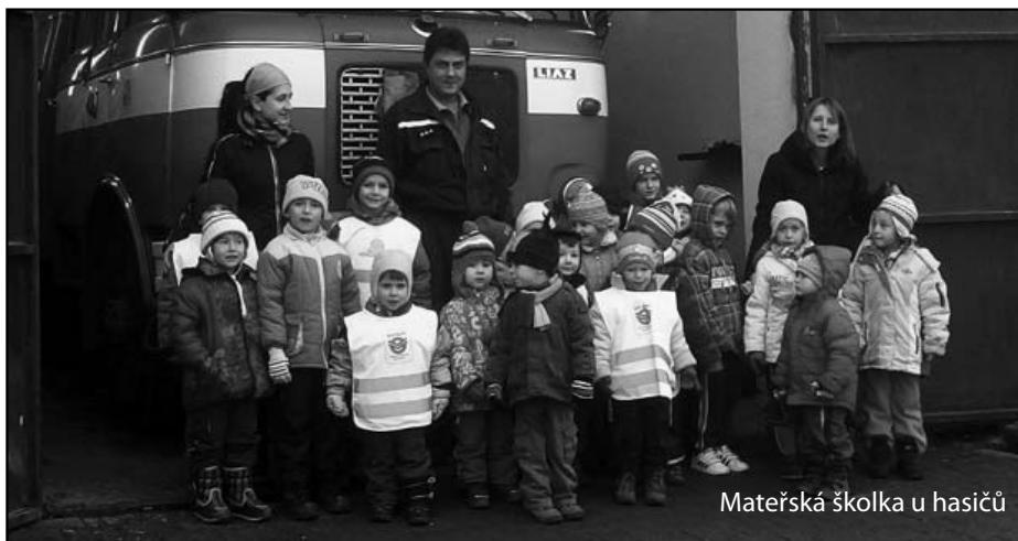
Mateřská školka u hasičů