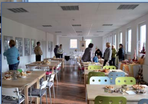
Oslavy v Občanském centru