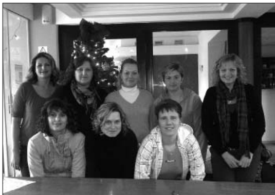
Za klub na víkend odložených žen E.K.

Vpředvánočním shonu se osm kamarádek z Hostěnic společně vypravilo na relaxační víkend do Starého Města. Stejně jako minulý rok jsme víkend prožily v pohodě při masážích, koupání se a zejména povídání si při kávě. Mohly jsme na chvíli vypnout a oprostít se od každodenního stereotypu. Myslím si, že jsme si to všechny užily a ostatním můžeme jen doporučit!!!