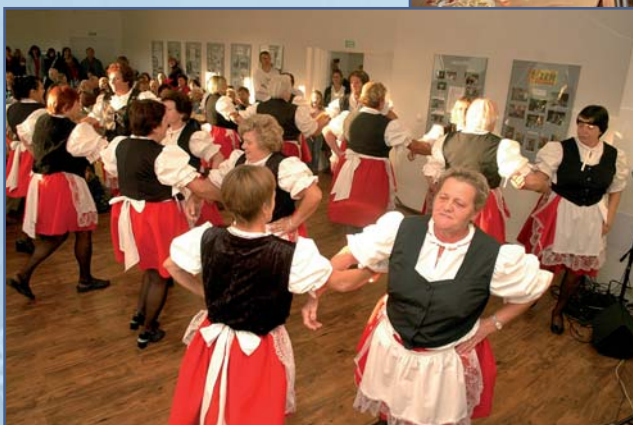
Hostějnické Boubelky v akci