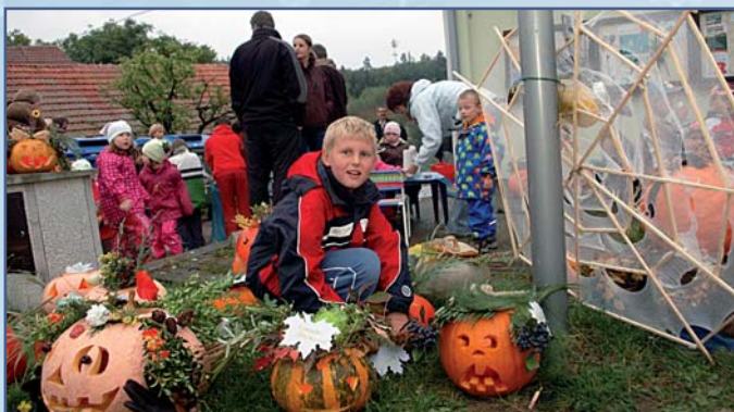
Každý chtěl mít dýni vystavenou na nejlepším místě