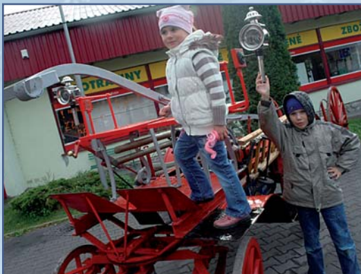
Výstava hasičské techniky JSDH Hostějnice