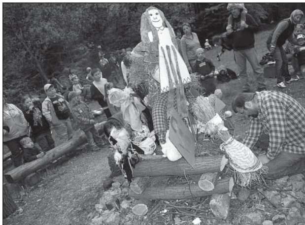
Den Země – pálení čarodějnic

stejně jako podrobnější informace o akcích již proběhlých, naleznete na našich webových stránkách www.hosten.estranky.cz .