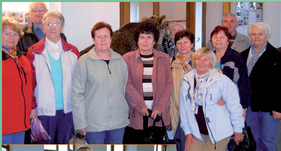
Senioři - výlet na Valaško