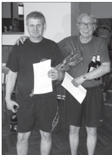
Prasátko – vítězové čtyřhry