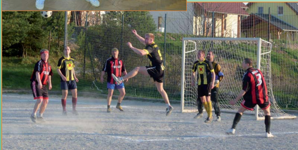
Obecní liga 2011