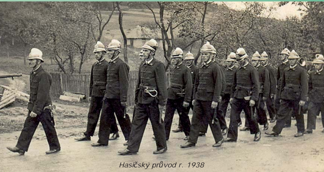
Hasičský průvod r. 1938

OSLAVA 105. VÝROČÍ ZALOŽENÍ SBORU DOBROVOLNÝCH HASIČŮ HOSTĚNICE 1906–2011