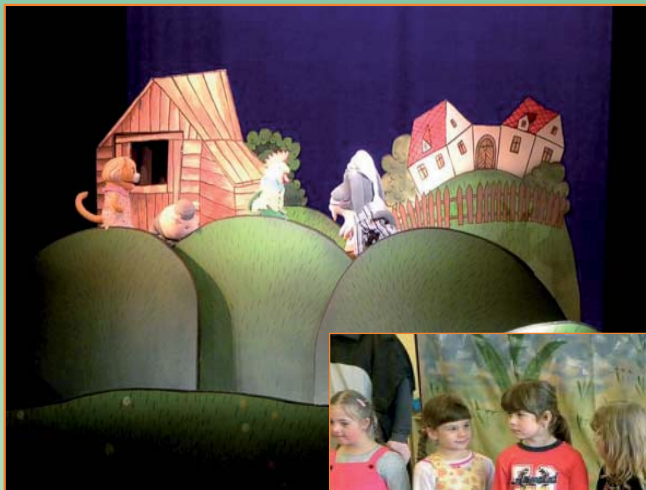
Divadlo v MŠ