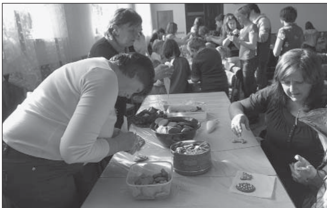
Velikonoční setkání- zdobení perníčků, výtvarné tvoření