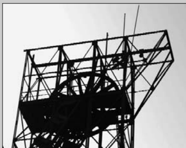
TIPY NA VÝLET

A zase po roce máme tu hody, budou už v červenci u hospody. Zábava to bude jistá, každý už ví co se chystá. Budem zpívat, tancovat a k tomu se radovat.