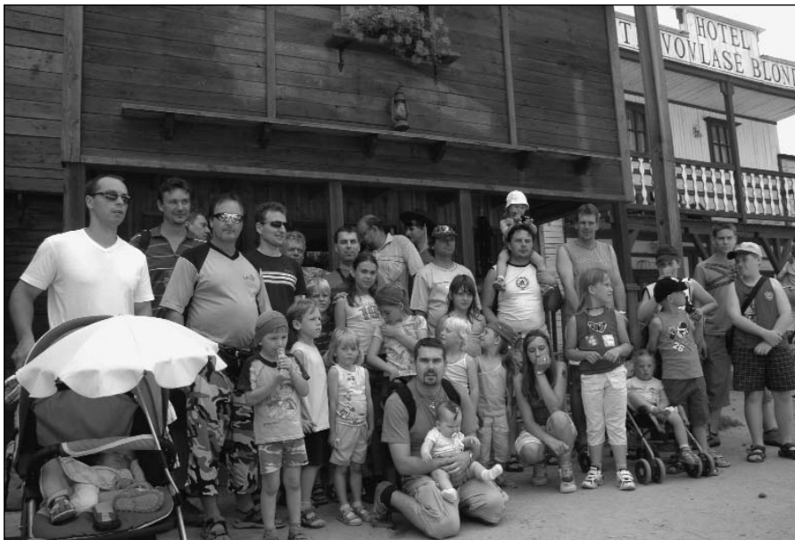
Na Den otců uspořádal Sbor dobrovolných hasičů Hostěnice výlet do Černé Hory a westernového městečka v Boskovicích na Blanensku.