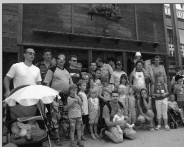
OSLAVA DNE OTCŮ